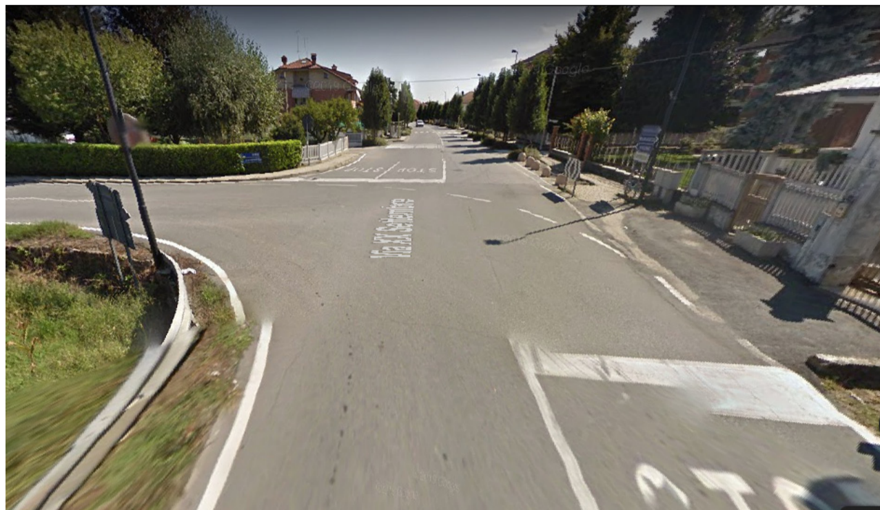
L'incrocio fra via XX Settembre e via Torino dove dovrebbe essere realizzata la nuova rotonda raso terra

L'opera finanziata con i fondi giunti dal Governo -I conti del Comune sono sani, con un significativo avanzo, anche dopo l'accantonamento dei fondi per le scuole.